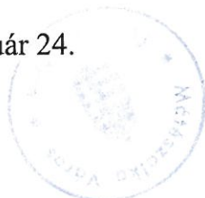
dr. Hanusi Péter polgármester